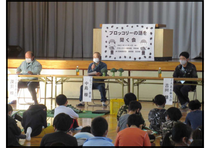
<3年 ふるさとを発見しよう>