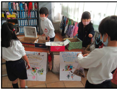
<1年 はっぱや実で遊ぼう>

新しい生活様式の中、新型コロナウイルス予防対策をとりながらの2学期でした。保護者の皆様にも毎日の検温チェックにご協力いただきありがとうございました。マスク着用と手指消毒、室内の換気や消毒を徹底し、『三密』を避けての厳しい日々が続いています。例年実施している行事もほとんど中止となり、保護者の皆様にも子供たちの学校での様子を観ていただくことができず申し訳なく思っております。ただ、「どんなことなら実施可能か」「どうしたら安全に実施できるか」と考え、少しずつ子供たちの活動の幅も広がってきています。